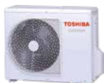
Zunanja naprava (simbolična slika)